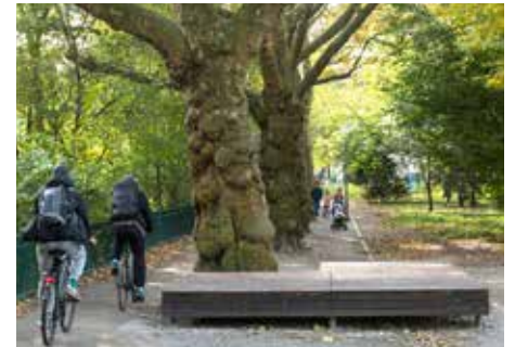
Die neuen Sitzplattformen bieten Raum für Entspannung.