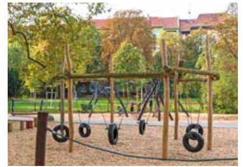
Blick auf den Spielplatz des Weichselplatzes