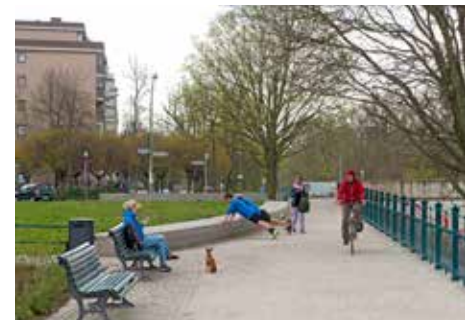
Der erweiterte Uferweg bietet nun ausreichend Platz für ein entspanntes Miteinander.