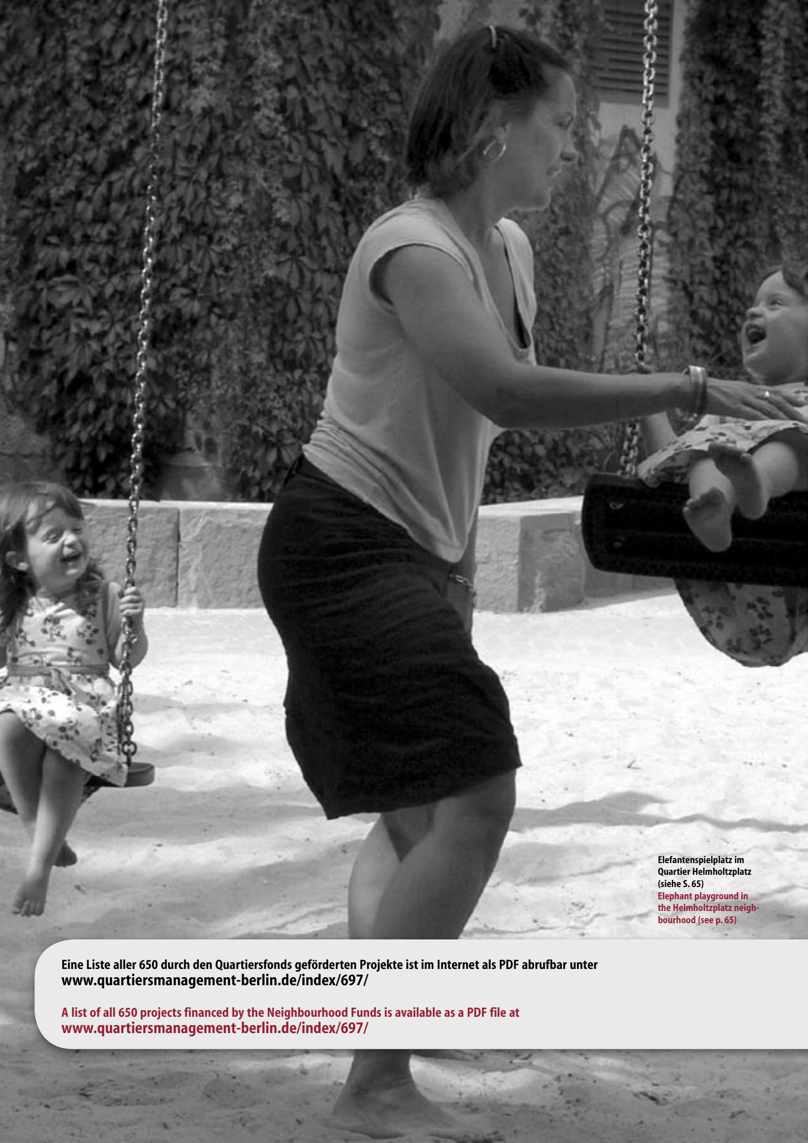
Elefantenspielplatz im Quartier Helmholtzplatz (siehe S. 65) Elephant playground in the Helmholtzplatz neigh- bourhood (see p. 65)

Eine Liste aller 650 durch den Quartiersfonds geförderten Projekte ist im Internet als PDF abrufbar unter www.quartiersmanagement-berlin.de/index/697/